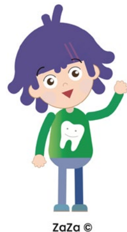
Abb. 2: Zaza führt Kinder zur Prophylaxe und in die Zahnarztpraxis.