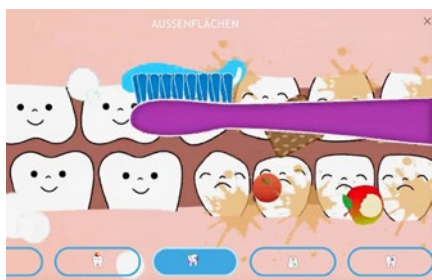
Abb. 3: Mit der KAI-Systematik werden die Zähne gereinigt. Eine sanfte Melodie begleitet die Zahnreinigung.

Zaza erklärt im Video «Karies», wie überhaupt Löcher in die Zähne kommen. Es gibt gute und böse Bakterien im Mund. Die bösen Bakterien vermehren sich durch Zuckerkonsum. Zähneputzen ist deshalb so nützlich, weil es die bösen Bakterien immer wieder reduziert. Im Video «Essen: Süssigkeiten» haben drei Freundinnen und Freunde von Zaza unterschiedliche Vorlieben. So isst Freundin Anna gerne Zuckerbonbons. Mit einer Spezialbrille (Äquivalent zur zahnärztlichen Lupenbrille) schaut sich Zaza die Zähne an. Dabei erklärt die Erzählerin –